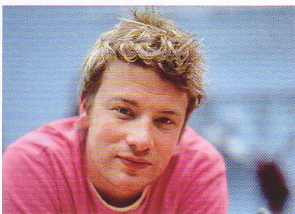
Jamie Oliver in Hamburg

Zum Herbst und Winter, wenn die Nächte länger werden, bricht die Zeit der Dinnershows in Deutschland an. Da steckt viel Geld drin. Das sagte sich