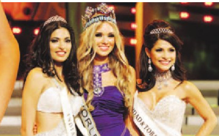
Die Drittplatzierte Parvathy Omanakuttan (links) und Vize-Miss Gabrielle Walcott (rechts) nehmen die strahlende Siegerin Xenia Suchinowa in die Mitte.