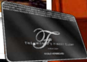
Die Mitgliedschaftskarte Für 2950 Franken zu haben.

Sonderkonditionen gabs auch für mein Zimmer im legendären Hotel Adlon, direkt am Brandenburger Tor. Hier weilten schon Berühmtheiten wie Greta Garbo und Albert Einstein. Ich reihe mich gerne temporär