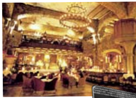
Wie in einem Schloss Das Interieur des Clubs Adagio am Potsdamer Platz.