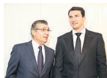
Gäste aus Deutschland: Rudi Assauer, Wladimir Klitschko